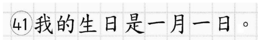
Рис.16. Образец написания иероглифических знаков

Записи в лист 1 и лист 2 бланка ответов № 2 делаются в следующей последовательности: сначала заполняется лист 1, затем заполняется лист 2. Записи делаются строго на лицевой стороне, обратная сторона листов бланка ответов № 2 по китайскому языку НЕ ЗАПОЛНЯЕТСЯ!!!